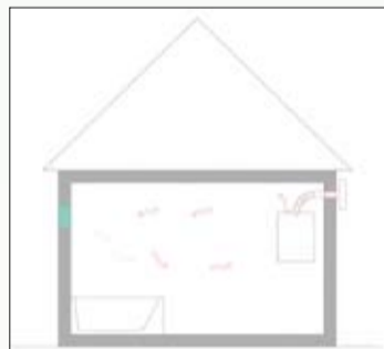
● Slika 1. Plinski aparat nije spojen na dimnjak

Na slici br. 2 dan je primjer plinskoga aparata tipa B 1 ili B 11 postavljenoga u kupaonicu, koji je spojen na dimnjak sa lošom toplinskom izolacijom. U ovom slučaju će aparat u povoljnim vremenskim uvjetima i uz dovoljno dobru dozraku raditi dobro. Kod nepovoljnih vremenskih uvjeta npr. hladnijeg vremena ovakav dimnjak je pre hladan pa nema dovoljno uzgona da odvede dimne plinove u okoliš, a u ljetnim mjesecima ovakav dimnjak