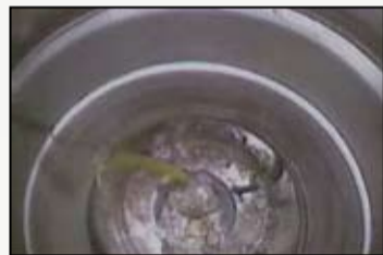
Dimovodne cijevi nisu spojene sa za to predviđenim brtvama

Najčešće greške prilikom sanacije dimnjaka uvlačenjem inox cijevi: