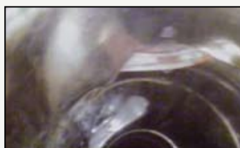
Sanacijske dimovodne cijevi na silu su gurane jedna u drugu