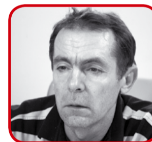
B.M.P. ovlaštenu projektanta strojarstva instalacija

od 1000 m 2 trebaju certifikat izložiti za javnost na vidljivo mjesto.