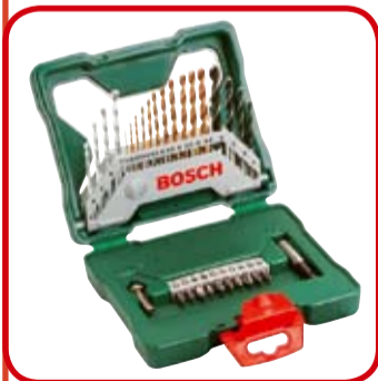
● Bosch set svrdala

Odgovor za nagradno pitanje 7. broja glasi: c) kod izgaranja 1m 3 plina produkt je nusprodukt, 2 m 3 vode koje odvodimo kao kondenzat