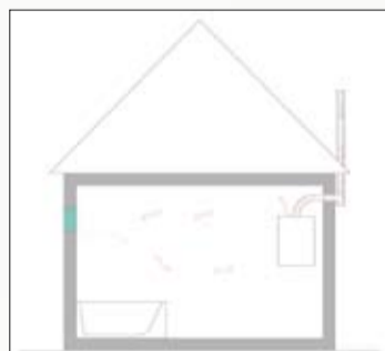
● Slika 2. Dimnjak bez izolacije