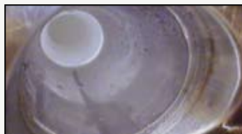
Sanacijska cijev sa znacima korozije mora biti zamijenjena