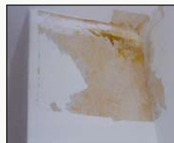
● Slika 4. Pojava kondenzata u dimnjaku

Na slici br. 3 dan je primjer plinskoga aparata tipa B 1 ili B 11 postavljenoga u kupaonicu, koji je spojen na dimnjak koje je unutarnja stjenka hrapava. Hrapavost stjenke dimnjaka se pojavljuje kod dimnjaka načinjenih od opeke, koji su prije priključka plinskoga aparata korišteni dugi niz godina za peći na kruta goriva. Kod ovakvog slučaja će hrapavost stjenke značajno povećati otpor strujanju dimnih plinova, što u početnoj fazi rada plinskoga aparata kada je dimnjak hladan, dovodi do pojave kondenzata u dimnjaku (slika br 4). Kondenzat dodatno otežava pravilan rad dimnjaka i dovodi do daljnjeg propadanja stjenke.